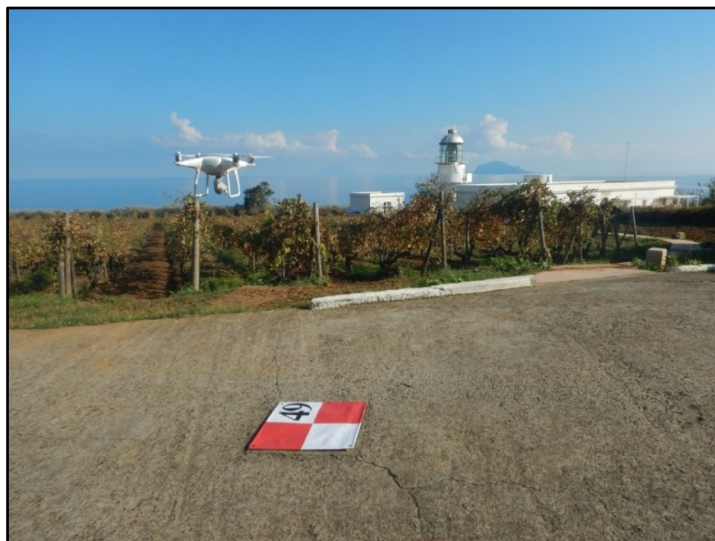
Figura 3 – Esempio di GCP

La metodologia descritta di seguito è stata applicata per il rilievo orto fotogrammetrico da SAPR :