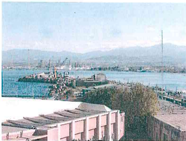
Terminale petrolifero visto dal molo di sopraflutto del porto.

Un ulteriore terminal per l'accoglienza e la bigliettazione dei passeggeri, con autovettura e camion, che intendono imbarcarsi al porto di Milazzo è stato realizzato negli anni scorsi in area demaniale lungo la via Acqueviole.