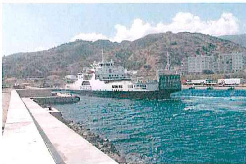
Porto di Tremestieri

Con riferimento al traffico di attraversamento dello Stretto, particolare considerazione merita i benefici ormai acclarati derivanti dal potenziamento delle infrastrutture portuali a seguito della realizzazione del terminal per navi ro-ro in località Tremestieri (zona distante dal porto circa 7 Km verso sud) dedicato attualmente solo all'imbarco e sbarco della quasi totalità dei mezzi pesanti.