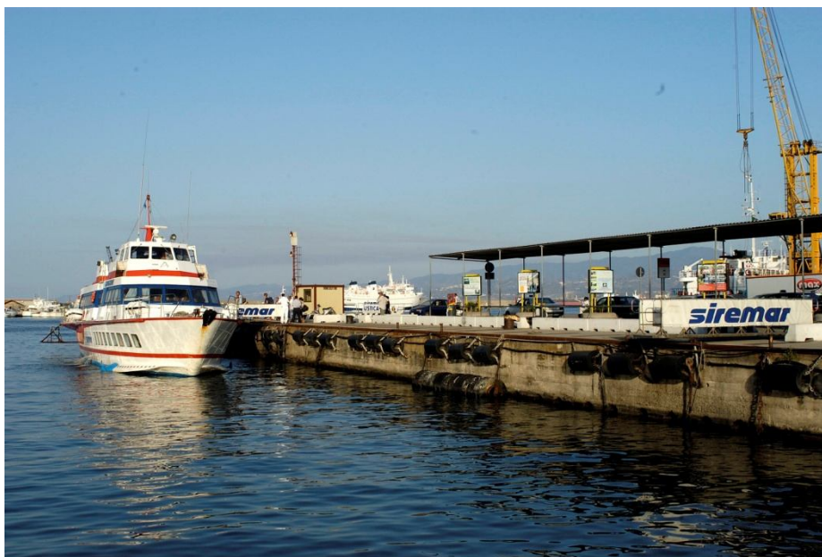
approdi per gli aliscafi al porto di Milazzo

Appena all'esterno dello specchio acqueo del porto di Milazzo insiste un terminale di raffinazione del greggio di primaria importanza (Raffineria Mediterranea), con ben tre pontili di accosto per grandi navi cisterna, due dei quali attivi costantemente, con potenzialità di accosto pari a quattro unità contemporanee. Tale funzione costituisce un valore aggiunto all'attività commerciale del comprensorio portuale in oggetto, anche se l'area interessata dei pontili è oggetto di concessione demaniale, pertanto la gestione ordinaria e straordinaria è di diretta competenza del concessionario.