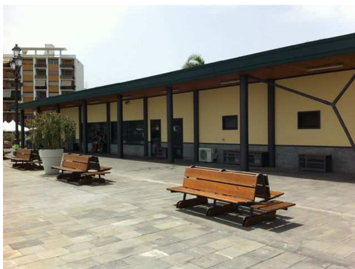
Vista esterna del nuovo Terminal Passeggeri del Porto di Milazzo

Le funzioni portuali primarie si sostanziano prevalentemente nel collegamento passeggeri e merci con le Isole Eolie e nella movimentazione, in particolare, di prodotti siderurgici.