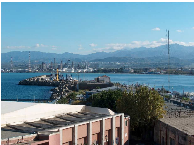
terminale petrolifero visto dal molo di sopraflutto del porto.

Una ulteriore infrastruttura di servizio al traffico ro-ro è stata completata sull'area demaniale lungo la via Acqueviola. Si tratta di un terminal per l'accoglienza e la bigliettazione dei passeggeri con autovettura e/o camion che intendono imbarcarsi al porto. Anche l'affidamento in gestione è ormai perfezionato. La struttura entrerà a regime il prossimo anno.