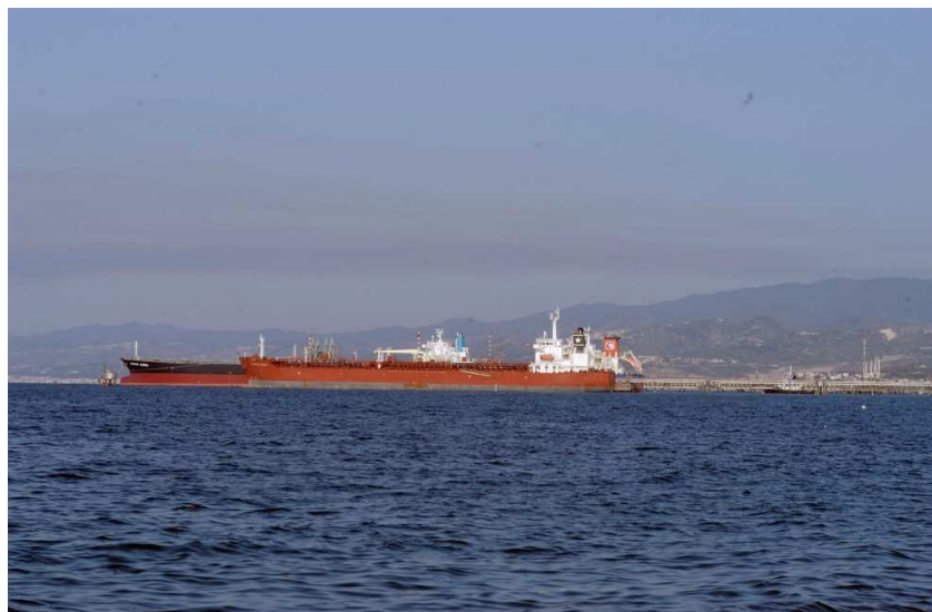
pontili della raffineria visti dal mare

Appena all'esterno dello specchio acqueo del porto di Milazzo insiste un terminale di raffinazione del greggio di primaria importanza (Raffineria Mediterranea), con ben tre pontili di accosto per grandi navi cisterna, due dei quali attivi costantemente, con potenzialità di accosto pari a quattro unità contemporanee. Tale funzione costituisce un valore aggiunto all'attività commerciale del comprensorio portuale in oggetto, anche se l'area interessata dei pontili è oggetto di concessione demaniale, pertanto la gestione ordinaria e straordinaria è di diretta competenza del concessionario.