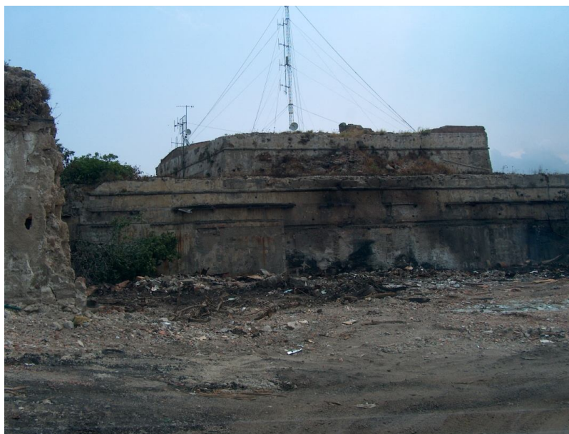
bastioni della fortezza "Real Cittadella" recentemente liberati da superfetazioni.

Infine, per quanto riguarda il flusso dei passeggeri, comparto nel quale il sistema portuale Messina – Milazzo occupa il primo posto in Italia con oltre dieci milioni di passeggeri transitati ogni anno, l'Autorità Portuale ha ormai messo in esercizio, con ottime soddisfazioni dell'utenza, il terminal galleggiante realizzato presso la banchina Peloro, e poi delocalizzato presso la banchina Rizzo per una migliore logistica portuale. L'avvio alcuni anni fa del sistema di collegamento denominato Metromare hanno indotto l'Autorità Portuale a spostare il terminal galleggiante sulla vicina banchina Rizzo, anche su istanza degli operatori e delle Autorità cittadine.