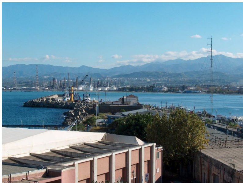
terminale petrolifero visto dal molo di sopraflutto del porto.

Nel POT 2015-2017 sono state inserite alcune nuove opere volte al miglioramento dei servizi e delle dotazioni dell'ambito portuale. È previsto l'allargamento del Molo Foraneo, al fine di realizzare una banchina di maggiore larghezza, idonea sia per le operazioni commerciali che per i servizi destinati al crocierismo, permettendo una migliore fruizione di tale area del porto.