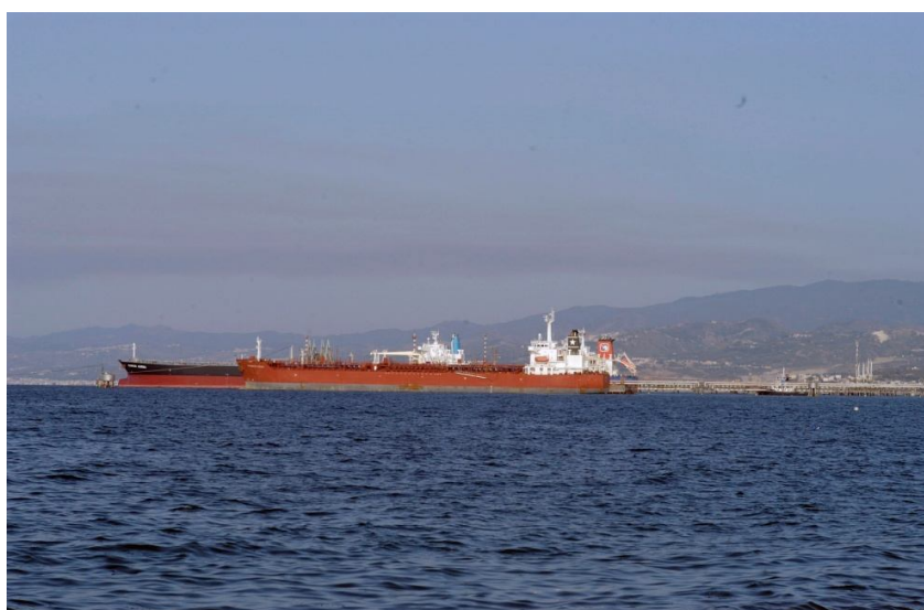
pontili della raffineria visti dal mare

Appena all'esterno dello specchio acqueo del porto di Milazzo insiste un terminale di raffinazione del greggio di primaria importanza (Raffineria Mediterranea), con ben tre pontili di accosto per grandi navi cisterna, due dei quali attivi costantemente, con potenzialità di accosto pari a quattro unità contemporanee. Tale funzione costituisce un valore aggiunto all'attività commerciale del comprensorio portuale in oggetto, anche se l'area interessata dei pontili è oggetto di concessione demaniale, pertanto la gestione ordinaria e straordinaria è di diretta competenza del concessionario.