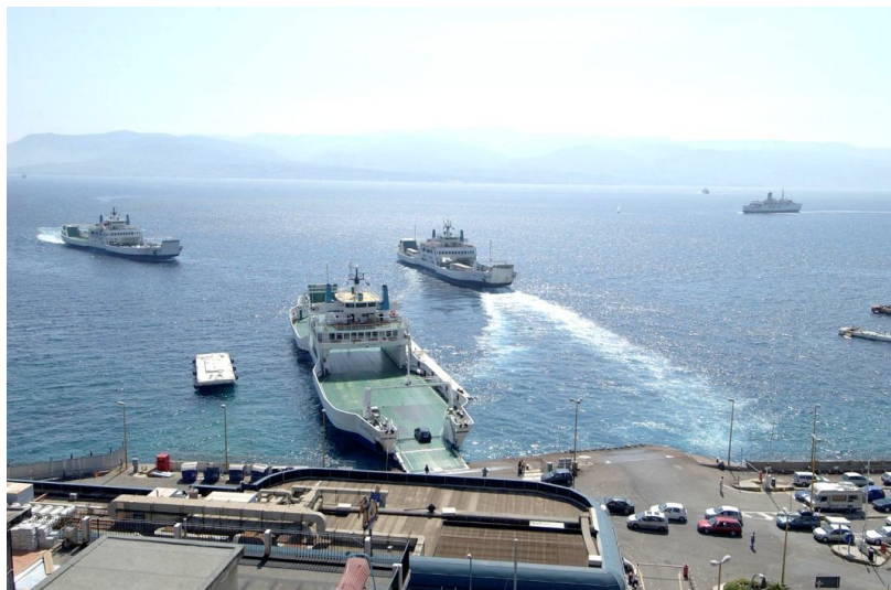
i traghetti dello stretto

Le funzioni portuali primarie si sostanziano prevalentemente nel traghettamento dello Stretto di Messina, nel crocierismo e nella movimentazione di prodotti siderurgici.