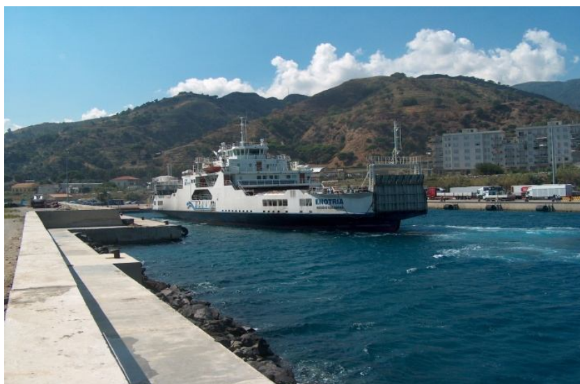
nuovo approdo di Tremestieri

Con riferimento al traffico di attraversamento dello stretto, particolare considerazione meritano i benefici ormai acclarati derivanti dal riassetto delle infrastrutture portuali in funzione della recente entrata in esercizio del nuovo terminal per navi ro-ro in località Tremestieri (zona distante dal porto circa 7 Km verso sud) dedicato attualmente solo all'imbarco e sbarco della quasi totalità dei mezzi pesanti.