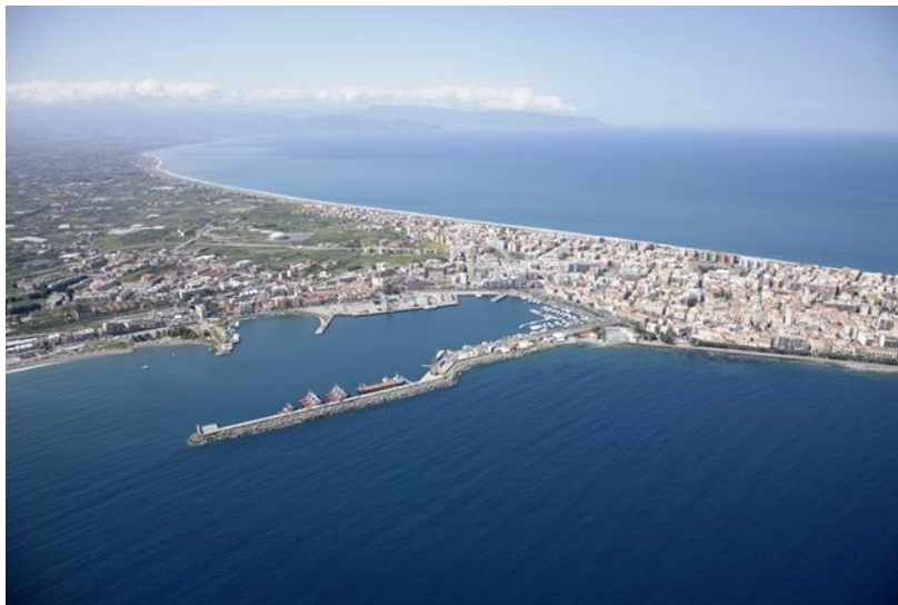
Vista aerea del Porto di Milazzo

Le funzioni portuali primarie si sostanziano prevalentemente nel collegamento passeggeri e merci con le Isole Eolie e nella movimentazione, in particolare, di prodotti siderurgici. In fase di espansione anche il traffico ro-ro con una linea che collega il Porto di Milazzo alla Campania.